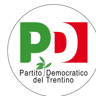
Partito Democratico del Trentino